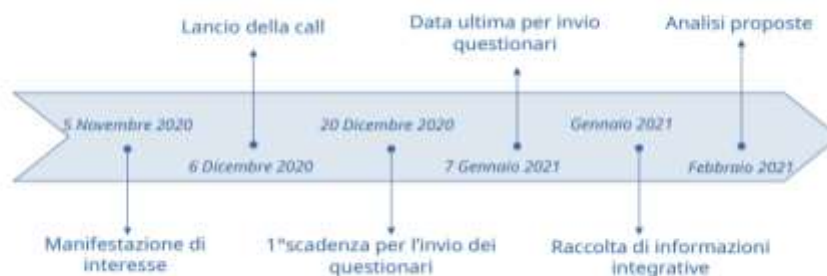
Figura 1. Cronologia dell'iniziativa per la raccolta di pratiche promettenti

Attori pubblici e privati, associazioni, organizzazioni di rappresentanza dei datori di lavoro e sindacati sono stati invitati a descrivere le loro pratiche rispondendo a un questionario on-line accompagnato da una guida e articolato in 37 quesiti, che ha permesso un'analisi sulla base di sette criteri oggettivi: pertinenza e coerenza, efficacia, impatto, efficienza, sostenibilità, innovazione e replicabilità. Alla data di scadenza della call, 60 partecipanti hanno compilato il questionario on-line e 7 di questi hanno presentato due differenti pratiche, per un totale di 67 proposte, esaminate e valutate da un gruppo di esperti in materia di lavoro e protezione sociale presieduto dal MLPS e supportato dall'OIL (Figura 1).